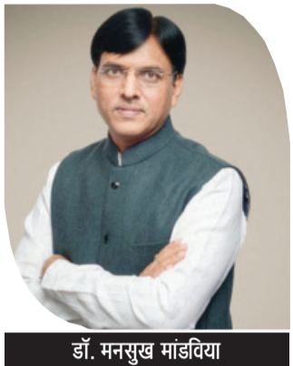
डॉ. मनसुख मांडविया

प्रयास है। वास्तव में, हमारे माननीय प्रधानमंत्री, श्री नरेंद्र मोदी का दृष्टिकोण—खेलों के माध्यम से विकास—आज साकार हो रहा है। खेल आज एक सशक्त माध्यम और समान अवसर प्रदान करने वाला